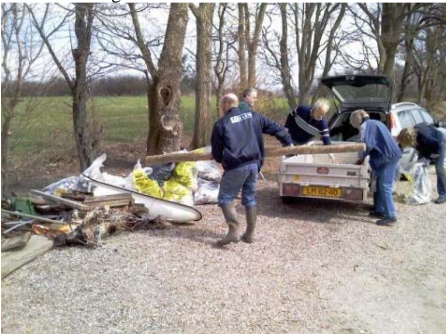
Affaldet lægges ved lejrskolen til afhentning ved Haderslev kommune.

Da vi ikke var så mange i år til at samle ind i vores område, nåede vi – i modsætning til sidste år – desværre ikke at samle ind langs vejene Gåsevig og Sønderballe Hoved. Men dér, hvor vi samlede ind, blev der pænt. Vi håber på større tilslutning næste år; så kan vi gøre en endnu større indsats for et rent landskab i Sønderballe Ejerlavs Beboerforenings område.