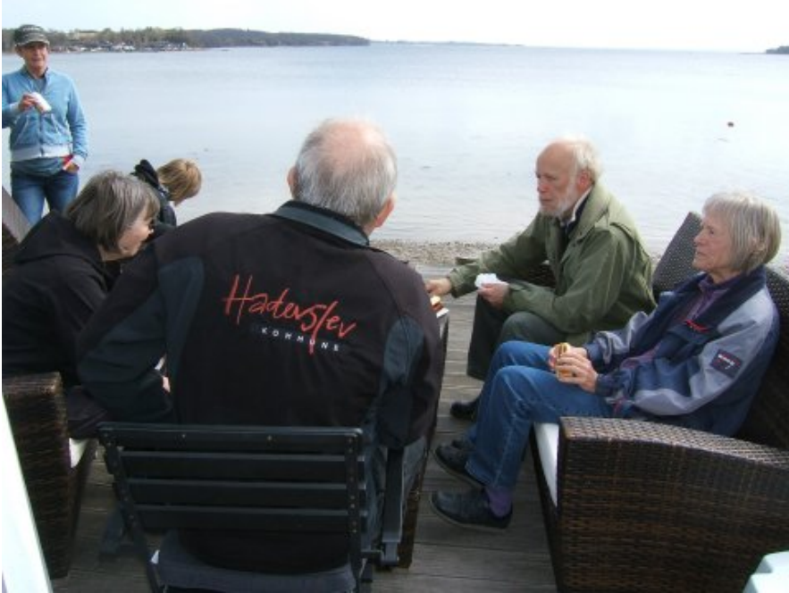
Efter arbejdet.