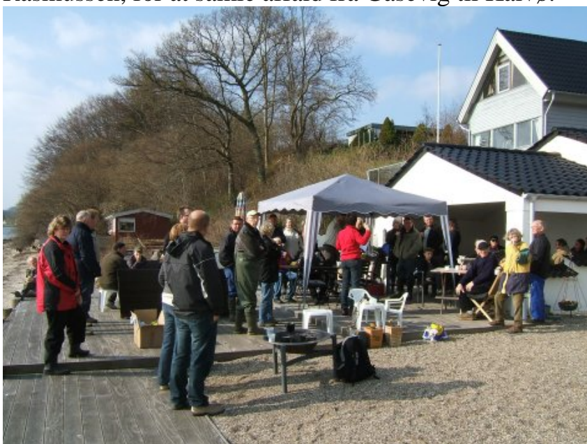
Efter morgenkaffen gives der instruktioner.