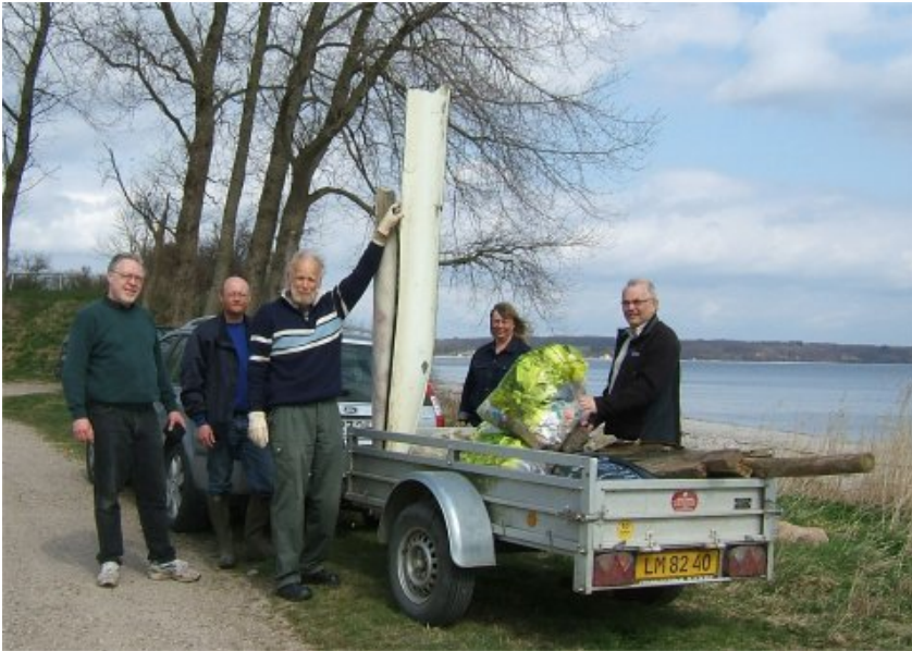
En del af indsamlingsholdet med dagens ”fangst”.

Da vi ikke var så mange i år til at samle ind i vores område, nåede vi – i modsætning til sidste år – desværre ikke at samle ind langs vejene Gåsevig og Sønderballe Hoved. Men dér, hvor vi samlede ind, blev der pænt. Vi håber på større tilslutning næste år; så kan vi gøre en endnu større indsats for et rent landskab i Sønderballe Ejerlavs Beboerforenings område.